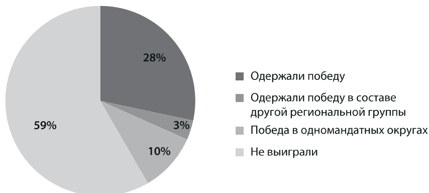
Рисунок 2. Результат победителей праймериз в ЦФО на выборах депутатов Государственной Думы VIII созыва